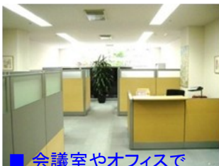
■ 会議室やオフィスで